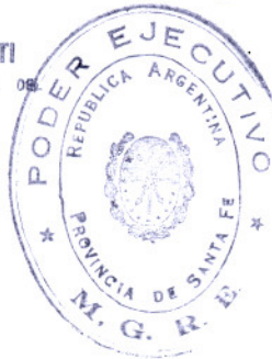
HERMES JUAN BINNER GOBERNADOR DE SANTA FE